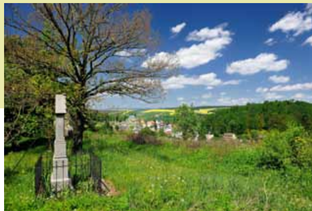
Vambeřice - Polsko.

Od té doby byly mnohé kříže poškozeny a zničeny. Pěšina byla místy zlikvidována a přestala být používána. Dnes je většina památek částečně opravených. Od roku 2002 se pokračuje v tradici procesí, které se koná vždy začátkem května z Police nad Metují.